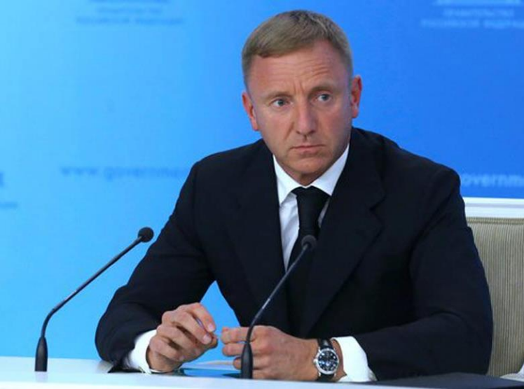
Министр образования и науки Дмитрий Ливанов в интервью телеканалу НТВ (2016 год)

«О распространенном мнении, что образование — это сфера услуг. У нас образование — это общественное благо, это право каждого человека, каждого гражданина Российской Федерации. И задача государства — обеспечить это право в полном объеме и на высоком уровне. Поэтому образование — это уже давно не сфера услуг в утилитарном понимании — ни с правовой точки зрения, ни с практической точки зрения»