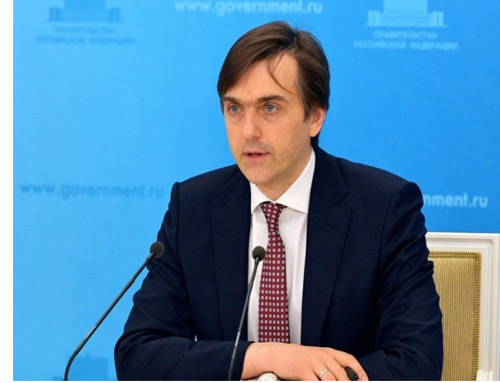
Министр просвещения Сергей Кравцов в эфире программы «Диалог» на канале «Россия 24» (2021 год)

«Нам нужно изменить (и это нужно делать сейчас, сегодня и сразу) отношение общества к служению учителя. У нас должно исчезнуть понятие услуги. Услуги не может быть в образовании. Мы не оказываем услуги, мы воспитываем и обучаем будущие поколения страны»