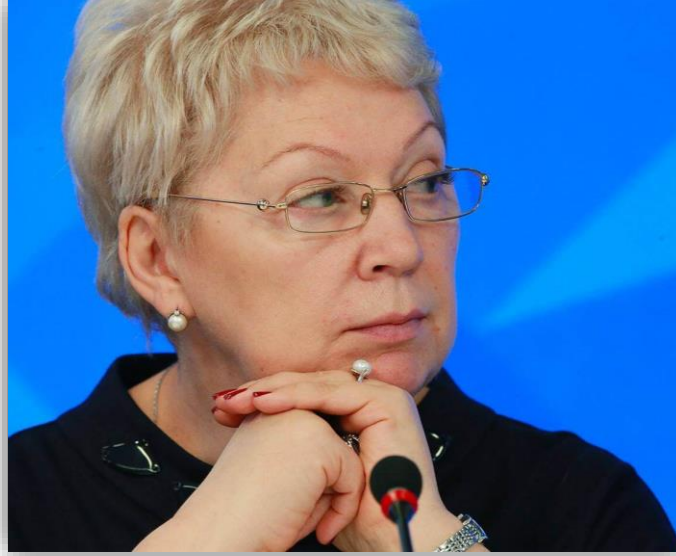
Министр образования и науки Ольга Васильева, Всероссийское родительское собрание (2016 год)

«О распространенном мнении, что образование — это сфера услуг. У нас образование — это общественное благо, это право каждого человека, каждого гражданина Российской Федерации. И задача государства — обеспечить это право в полном объеме и на высоком уровне. Поэтому образование — это уже давно не сфера услуг в утилитарном понимании — ни с правовой точки зрения, ни с практической точки зрения»